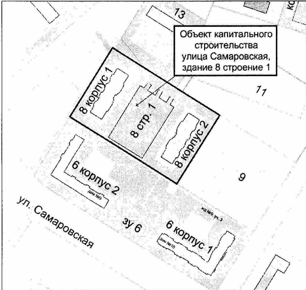
Схема расположения объекта недвижимости